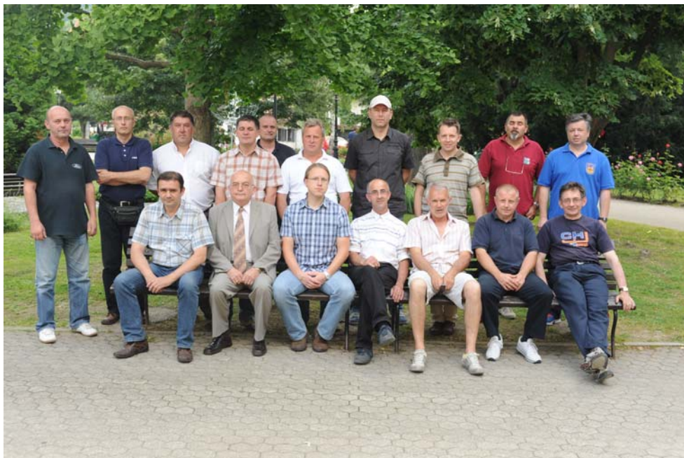
Zajednički snimak nazočnih branitelja-polaznika doškolanja koji uspješno završavaju ciklus obrazovanja.