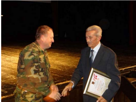
18.9.2016.godina u kino dvorani Samobor povodom 25-te god. 151.brigade

Cijeli je život general Stipetić proveo je na čast Hrvatskoj vojsci čistog obraza, neokaljan, bez optužnice i presude, bez kriminalnog tereta, bez tereta od ratnog zločina. Posebno je inzistirao na Ženevskoj konvenciji o ratnim zarobljenicima. General sa najvišim odličjima koje se mogu ostvariti u Hrvatskoj vojsci. No politika ga nije voljela, njega su željeli zaboraviti. Nisu ga pozivali na mnoge svečanosti i obljetnice na nivou države. Na žalost nisu ga čak lani zvali u Petrinju na godišnjicu predaje „krajinske“ vojske, jedne od najvećih ratnih pobjeda u novijoj hrvatskoj povijesti . Pobijedio je čisto i časno. Nije lažno paradirao uveličavajući svoje ratne pobjede. Nije imao što preuveličavati. Zasluge su mu i onako prevelike.