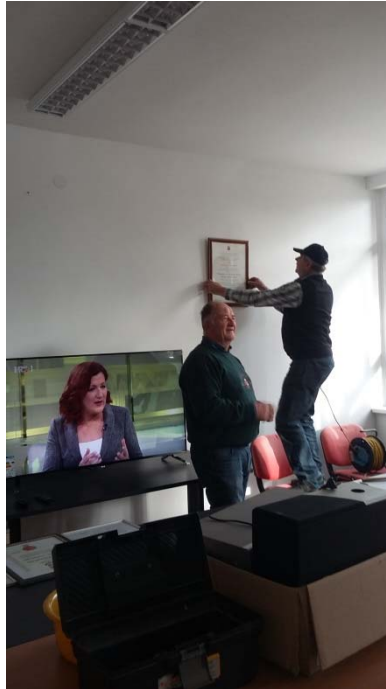
završne faza preseljenja-montaža slika

Nakon preuzimanja prostora od strane Grada Samobora i potpisivanja ugovora o najmu, uprava udruge je 2. prosinca organizirala preseljenje namještaja u nove prostore.